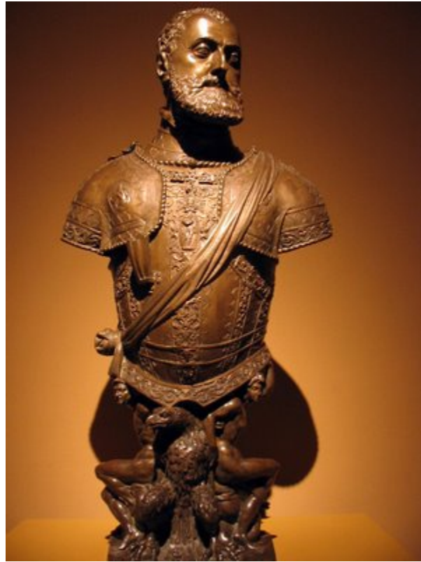
Don Carlos I de España e Indias