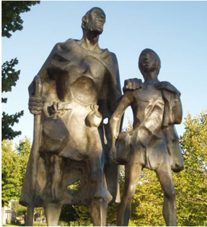
Fray Juan de Ortega

El 15 de enero de 1541 hace la erección canónica de la diócesis en Sevilla, y ahí mismo es consagrado obispo. Preparado su viaje a México, llega medio enfermo, estando de tránsito por Veracruz hacia México, "fatigado por la sed y calentura, se levantó a media noche a beber, estaban en una ventana de su aposento a serenar algunas vasijas de diferentes aguas, toma equivocadamente agua de "solimán" muriendo envenenado en la casa de Zumárraga, fue enterrado en la Catedral de México.