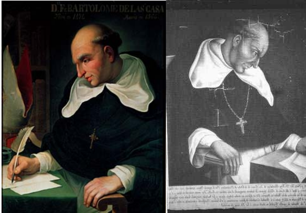
Fray Bartolomé de las Casas

La población española de Ciudad Real lo recibe con recelo, porque conocían bien su participación en la elaboración de las Leyes Nuevas, que daban protección a los indios. Llegando a su Sede con cierta intransigencia con su clero, en sus nuevas medidas pide a la gente que denuncie a sus curas, si hubiera algo deshonesto o mala vida, quitándoles las licencias para confesar, encarceló al Deán y excomulgó al Presidente de la Real Audiencia; provocó el rechazo de su clero y de los pobladores por sus medidas extremas. [9] A los frailes dominicos les prohibió hospedarse, comer en casa de españoles y consumir gallina o carne. En sus avisos decía "todo lo hecho hasta ahora en las Indias ha sido moralmente injusto y jurídicamente nulo"; sin licencia abandonó su diócesis y regresó a España en 1547, dejando una herida profunda en el clero y en la población; por las leyes que había impuesto provocó la división entre las diferentes órdenes que empezaban la obra misionera en Chiapas: franciscanos y mercedarios contra dominicos y diocesanos.