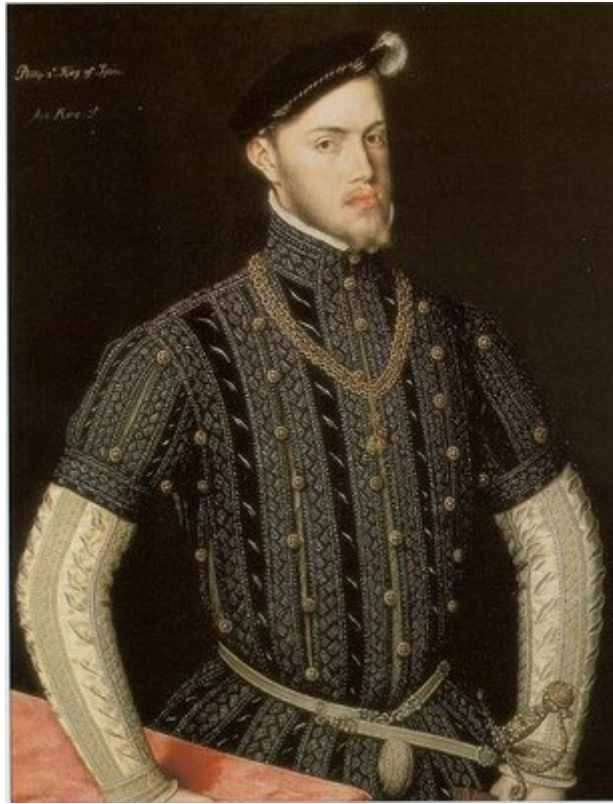
S.M. Católica don Felipe II Rey de España, Indias y Portugal