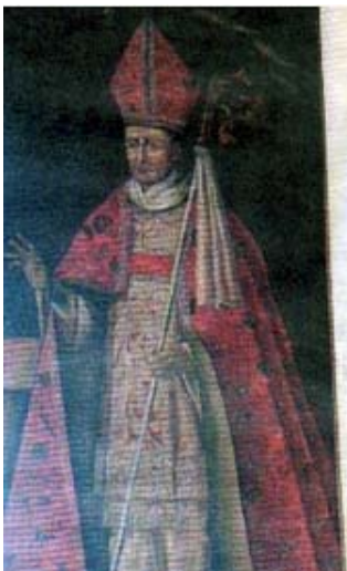
Fray Julián Garcés Obispo de Tlaxcala

Las distancias y la no clara limitación de jurisdicción de los obispados de Guatemala y México trajo rivalidades entre sí. Esta confusión, motivó disputas por los diezmos; suscitó enfrentamientos con el obispo de Guatemala, Francisco Marroquín, alegando tener derechos territoriales sobre Chiapas por ser vecino de su sede episcopal, además sentía que era parte de su territorio.