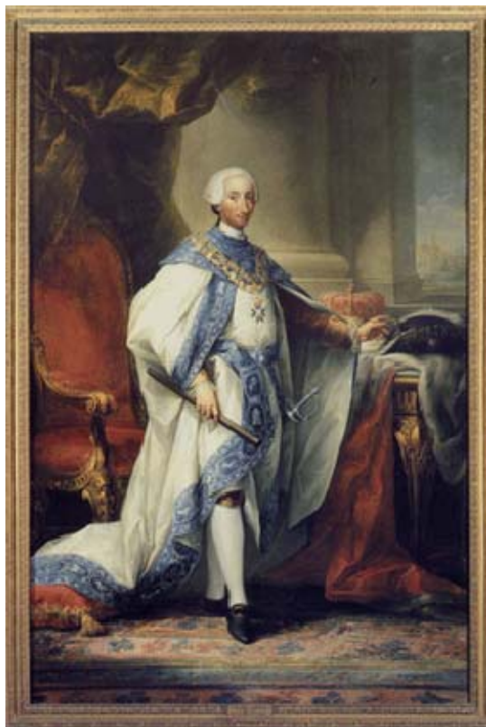
Don Carlos III rey de España e Indias

Fue el periodo de grandeza en el obispado de Chiapas en todos los aspectos: el cultural se dotó de una biblioteca con importación de libros; se reedificó el seminario, se empedró la ciudad y dotó de alhajas las iglesias y templos.