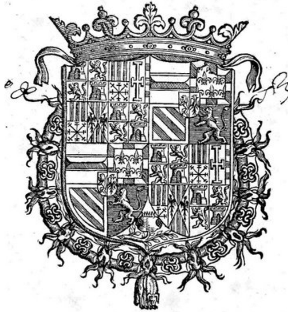
Armas de S. M. Don Carlos I Rey de España e Indias