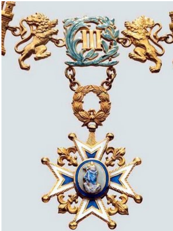
Gran collar de la Orden de Carlos III

El obispo Ambrosio de Llano y López (1801- 1815) ante el levantamiento de independencia de Miguel Hidalgo, cree por una parte, que no hay marcha atrás al clamor de independencia y desde Comitán informa al obispo la necesidad de la libertad del dominio español. Hacen presencia las tropas en 1813 por Tonalá, que lideraban los insurgentes, el Obispo se refugia en Tila, el santuario de los Choles, esperando tiempos mejores por espacio de un año. Finalmente el fraile dominico Matías de Córdoba y Ordóñez consuma en Comitán los ideales de independencia.