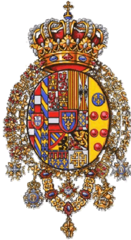
Armas de don Carlos III