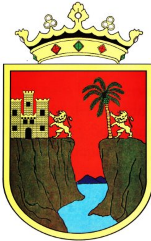
Escudo de Armas de Chiapas