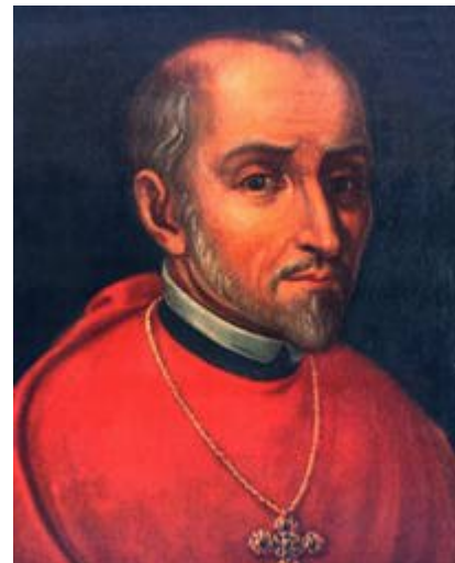
Francisco Marroquín Obispo de Guatemala