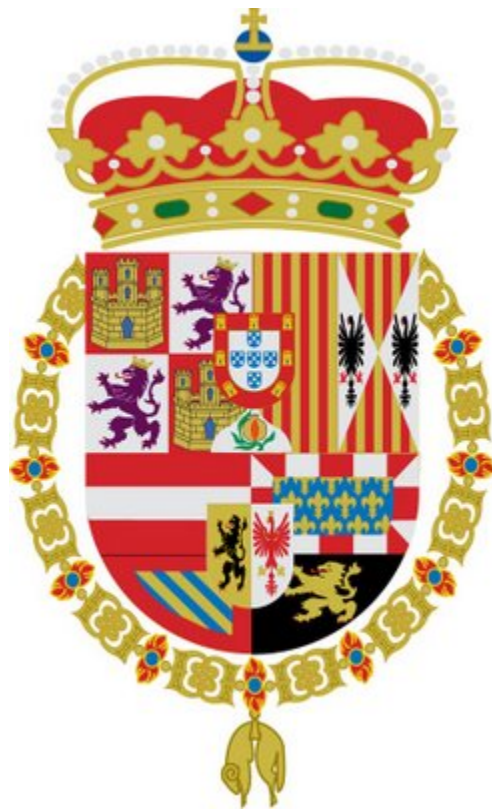
Armas de Don Felipe II