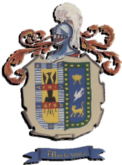
Armas de la Casa de Moctezuma

Después de su muerte, ya ningún dominico será obispo de Chiapas. Ante la masacre de frailes que se efectuó en 1712, la orden se repliega a sus haciendas y conventos, resisten los embates de las leyes borbónicas sostenidos por una buena economía conventual que les da fuerzas de resistencia y subsistencia.[24] El franciscano Juan Bautista Álvarez de Toledo 1708-1712, [25] al llegar a su diócesis le toca enfrentar la más grave crisis social y económica de Chiapas durante el siglo XVIII, el levantamiento indígena, llamado de los zendales, mezcla de fanatismo religioso y explotación de los indios, por las encomiendas; se inicia con el homicidio de varios doctrineros dominicos y los alzados indígenas, la repercusión de los supuestos mensajes de videntes de la Virgen María a María Candelaria dando esperanza a una nueva época dorada de libertad. [26] Don Jacinto Olivero y Pardo emprende su pontificado con obras en la catedral y sala capitular, al dotar de retablos y embellecer la ciudad. Con él empieza la galería de pinturas de los obispos en la sala capitular. Descubre la ciudad de Palenque, en forma casual, en 1746.