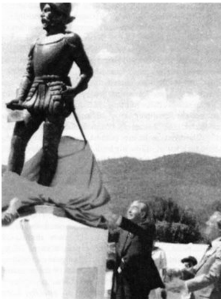
Don Diego de Mazariegos

Una vez conquistado el territorio que conforma Chiapas por el conquistador Don Diego de Mazariegos, funda en el año de 1528 la Ciudad, con el nombre de Villa Real de San Cristóbal. [1]