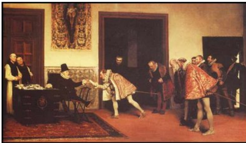
Corte de Felipe II

Los mercedarios nunca se comprometieron en la evangelización entre los indios; su atención es esencialmente la población hispana en Ciudad Real. Los franciscanos se expanden hacia Simojovel y Huitiupán, fundando sus conventos entre los tsotsiles y choles de Moyos, por la rivera de Sabanilla.