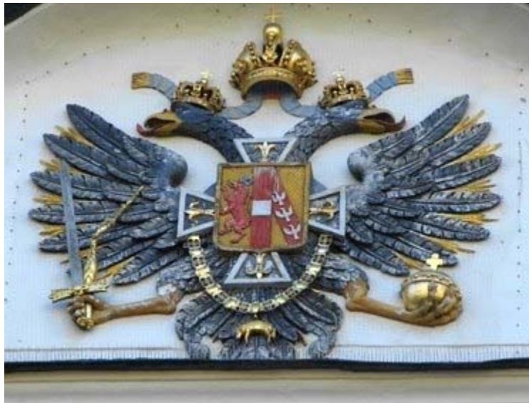
Armas de la Casa Real de Austria acoladas con el Toisón de Oro y el Aguila bicéfala

Fray Juan de Ortega de la Orden de San Jerónimo, es presentado como primer obispo de Chiapas , el 19 de marzo de 1539, esperando las bulas para su consagración, muere sin ser consagrado. [5] Es propuesto por el emperador al Papa el 16 de julio 1540, fray Juan de Arteaga [6] amigo y compañero de San Ignacio de Loyola, como segundo obispo.